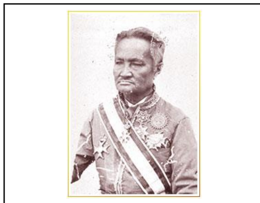
ภาพที่ 1 สมเด็จพระยาบรมมหาศรีสุริยวงศ์ (ช่วง บุนนาค)