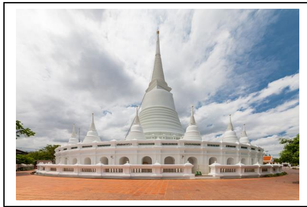
ภาพที่ 3 วัดประยุรวงศาวาสวรวิหาร