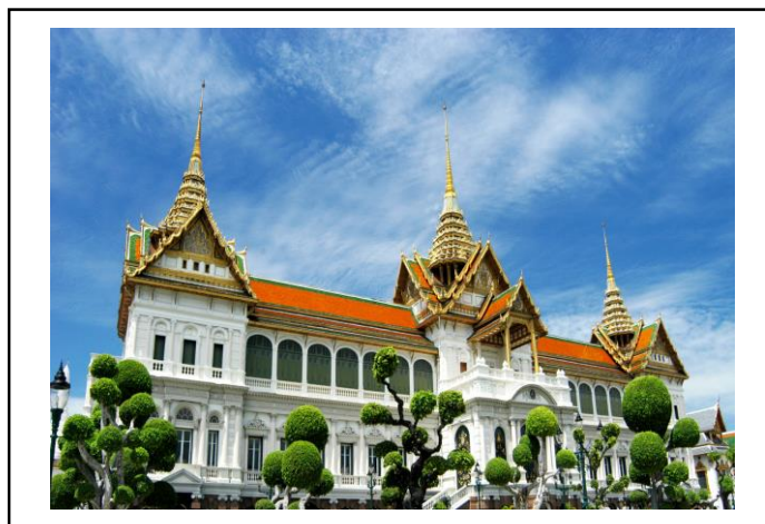
ภาพที่ 9 พระที่นั่งจักรีมหาปราสาท

พระบาทสมเด็จพระจุลจอมเกล้าเจ้าอยู่หัวเมื่อพระองค์ทรงได้รับทราบถึงข้อทักท้วงของสมเด็จพระเจ้าพระยาบรมมหาศรีสุริยวงศ์เรื่องหลังคาพระที่นั่งจักรีมหาปราสาท พระองค์จึงทรงโปรดเกล้าโปรดกระหม่อมให้ระงับการก่อสร้างหลังคากลมฐานสี่เหลี่ยมตามแบบสถาปัตยกรรมยุโรป แล้วให้สร้างหลังคาเป็นยอดปราสาทตามแบบสถาปัตยกรรมแบบไทยประเพณีแทน เมื่อพระที่นั่งสร้างเสร็จพระบาทสมเด็จพระจุลจอมเกล้าเจ้าอยู่หัวจึงพระราชทานนามว่า “พระที่นั่งจักรีมหาปราสาท” ซึ่งคำว่าปราสาทต่อท้ายพระที่นั่งนั้นก็เพราะว่าหลังคานั้นเป็นยอดปราสาทจึงมีคำว่าปราสาทต่อท้ายตามโบราณราชประเพณีที่สืบต่อมาตั้งแต่ครั้งกรุงศรีอยุธยา และมักเรียก “พระที่นั่งจักรีมหาปราสาท” ว่า “ฝรั่งสวมชฎา”