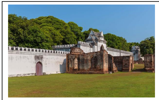
ภาพที่ 4 พระนารายณ์ราชนิเวศน์

พระบาทสมเด็จพระจอมเกล้าเจ้าอยู่หัวพระองค์ได้ดำริว่า ซึ่งพระบาทสมเด็จพระจอมเกล้าเจ้าอยู่หัวทรงเห็นว่าพระราชวังของสมเด็จพระนารายณ์มหาราชสามารถที่จะปฏิสังขรณ์ของเดิมที่ยังพอซ่อมแซมได้ ก็คือ พระที่นั่งจันทรพิศาล กับกำแพงและประตูพระราชวังโดยรอบ พระองค์ทรงพระกรุณาโปรดเกล้าโปรดกระหม่อม ให้มีการสร้างพระที่นั่งเป็นที่ประทับขึ้นหมู่หนึ่งเป็นพระที่นั่ง 3 ชั้น เป็นพระที่นั่งเพื่อพระบรรทม พระราชทานนามว่า พระที่นั่งพิมานมงกุฏ อยู่ระหว่างพระที่นั่งจันทรพิศาลกับพระที่นั่งดุสิตสวรรค์ธัญมหาปราสาท สร้างห้องพระโรง 2 ชั้น ต่อมาทางทิศตะวันออก พระราชทานนามว่า พระที่นั่งวิสุทธิวิจิตรนิจฉัย มีพระที่นั่งน้อยอยู่หน้าห้องพระโรง อีก 2 องค์คู่กัน ได้แก่พระที่นั่งไชยศาสตรากร และพระที่นั่งอักษรศาสตราคม นอกจากนี้ยังมีตำหนักใน และอาคารอีกหลายหลัง(อหิตยา ธีระโชติ, 2559. หน้า17) พระราชทานนามรวมกันทั้งหมดว่า พระนารายณ์ราชนิเวศน์