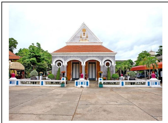
ภาพที่ 8 วัดศรีสุริยวงศารามวรวิหาร