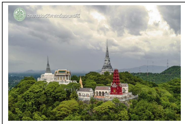
ภาพที่ 5 พระนครคีรี

ยอดเขาด้านตะวันตก เป็นส่วนที่ใช้ก่อสร้างพระราชวังซึ่งเป็นที่ประทับ มีหมู่พระที่นั่งหลายองค์ และอาคารต่าง ๆ ได้แก่พระที่นั่งเพชรภูมิไพโรจน์ พระที่นั่งปราโมทย์มไหสวรรย์ พระที่นั่งเวียงยันทวีเชียรปราสาท เป็นต้น นอกจากนี้ยังมีโรงมหรสพ หรือโรงโขน ศาลาลูกขุน และอาคารอื่น ๆ (กรมศิลปากร ,2566)