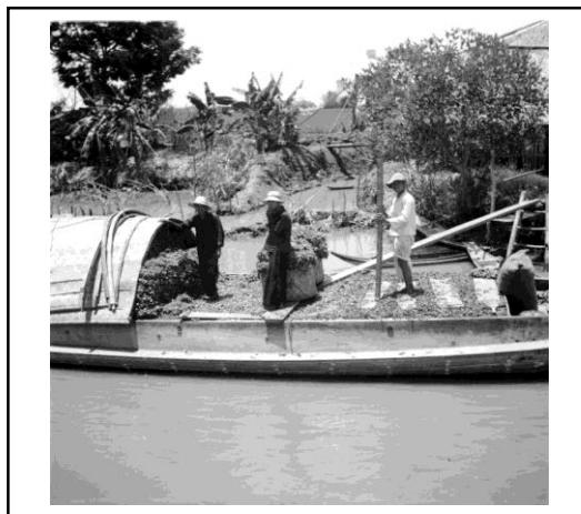
ภาพที่ 6 คลองดำเนินสะดวกในอดีต